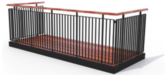
Type 4, balustre af fladestælsprofiler, med medløber