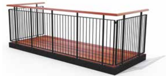
Type 2, balustre af rundstælsprofiler, med medløber