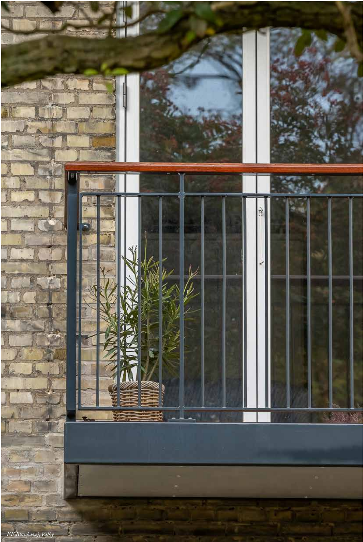
EF Blankovej, Valby