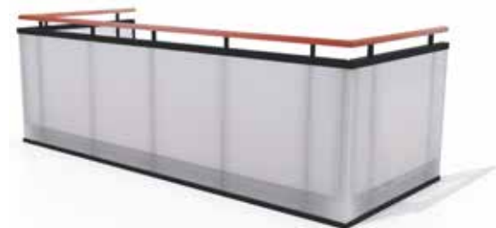
Type 5, hærdet og lamineret glas