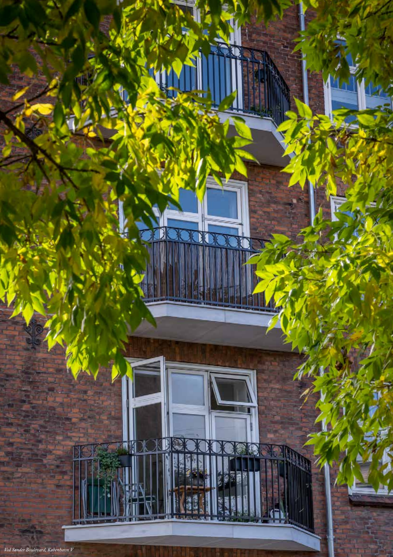
Ved Sander Boulevard, København V