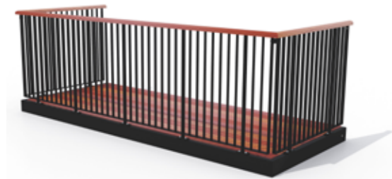
Type 3, balustre af fladestælsprofiler, uden medløber