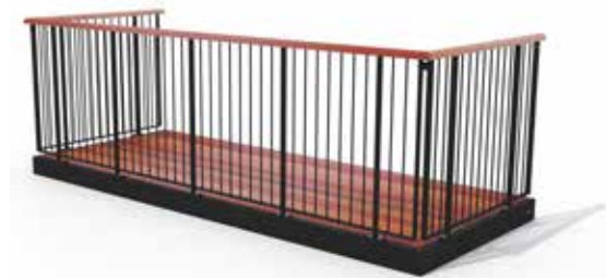
Type 1, balustre af rundstælsprofiler, uden medløber

valg, når vi taler om design. Den er i princippet vedligeholdelsesfri, så du kan nyde din tid med familie og venner. Balcos skæddersyede altaner produceres i galvaniseret stål og fås i flere forskellige varianter.