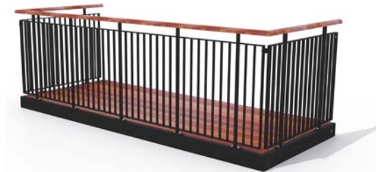
Type 4, balustre af fladestålsprofiler, med medløber