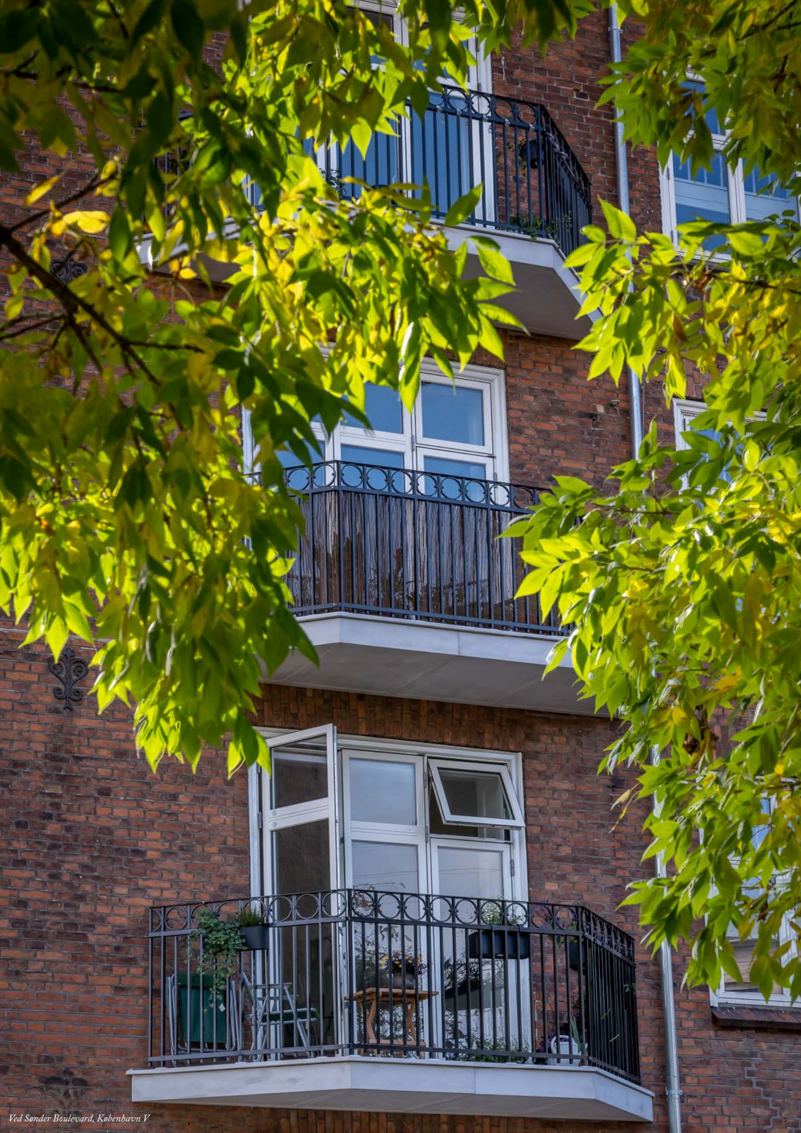
Ved Sander Boulevard, København V