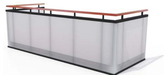
Type 5, hærdet og lamineret glas