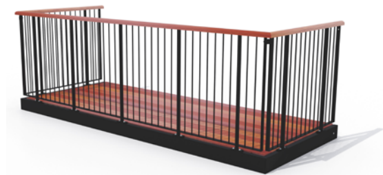
Type 1, balustre af rundstålsprofiler, uden medløber

valg, når vi taler om design. Den er i princippet vedligeholdelsesfri, så du kan nyde din tid med familie og venner. Balcos skæddersyede altaner produceres i galvaniseret stål og fås i flere forskellige varianter.