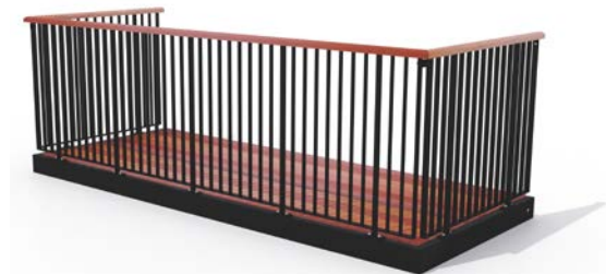
Type 3, balustre af fladestålsprofiler, uden medløber