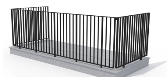
Type 6, altan i fiberbeton