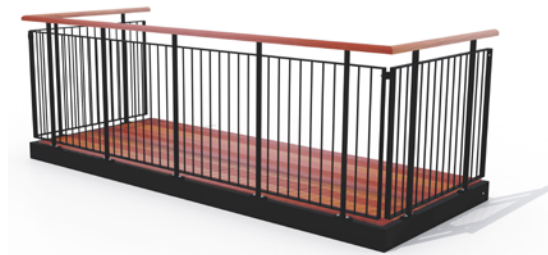
Type 2, balustre af rundstålsprofiler, med medløber